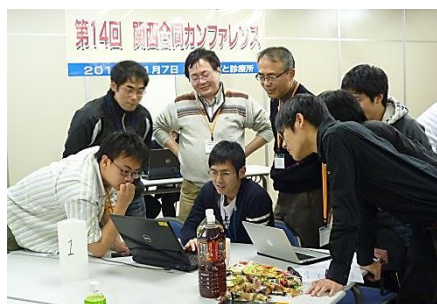
毎回多くの医学生の方が参加しています。