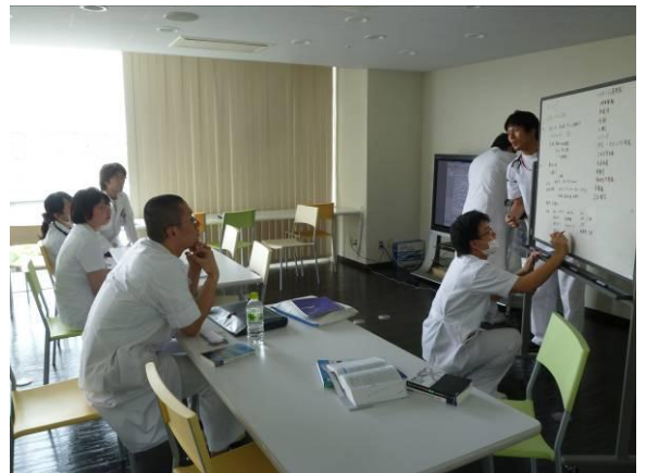
↑指導医、研修医の先生方と一緒に、鑑別診断から考えていきました。