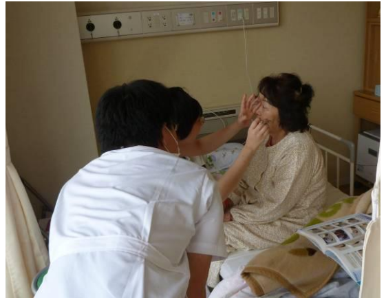
↑患者さんを前にドキドキの身体診察。 1年目の先生が優しく指導してくれました。

「History & Physical コース」では、患者さんの主訴と現病歴から鑑別診断を考えて、身体所見をとりながら疾患を診断していく過程を体験しました。